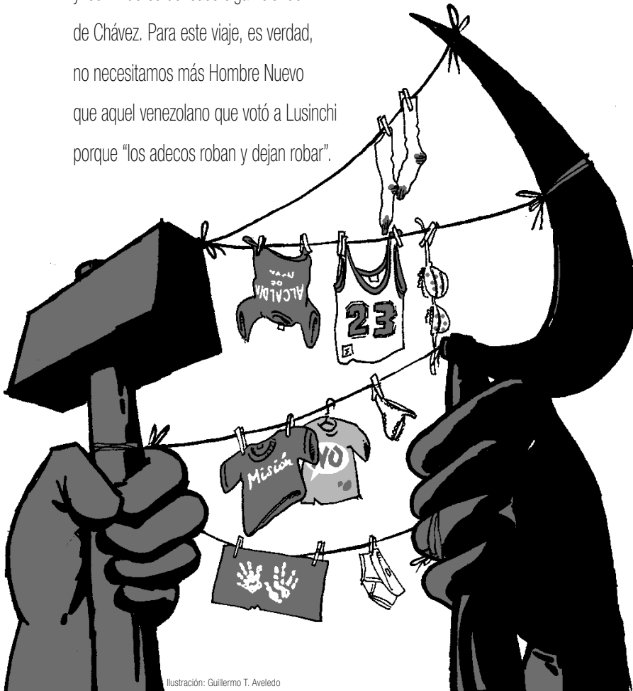
Ilustración: Guillermo T. Aveledo

El socialismo del siglo XXI será, en resumidas cuentas, algo verdaderamente novedoso: economía estatizada sobre un Estado en derrumbe; empresas sin empresarios y mercados sin mercaderes para una economía de importaciones o anaqueles vacíos; inspirada improvisación del Caudillo en lugar de coordinación por el mercado o planificación central; y sobre todo, distribución de renta petrolera a cambio de obediencia política, dinero rodando sin esfuerzo ni riesgo para que el pueblo y los vividores del caso sigan siendo de Chávez. Para este viaje, es verdad, no necesitamos más Hombre Nuevo que aquel venezolano que votó a Lusinchi porque "los adecos roban y dejan robar".