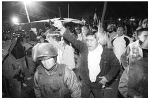
Seguidores del MAS en Padcaya, en protesta contra el referéndum autonómico de Tarija, anoche.