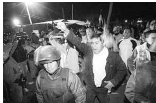
Seguidores del MAS en Padcaya, en protesta contra el referéndum autonómico de Tarija, anoche.