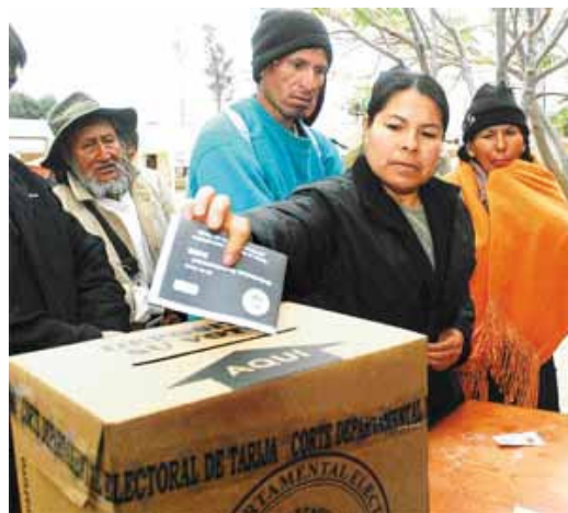
Una mujer deposita su voto sobre los estutos autonómicos en un recinto electoral, ayer en Tarija.