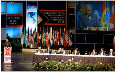
Disertación en la última asamblea del Banco Interamericano de Desarrollo, celebrada en Guatemala

Copyright 2007 SA LA NACION | Todos los derechos reservados