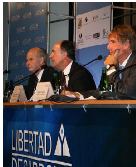
Presentación del libro "La Transformación Económica de Chile. El Modelo del Progreso" de Hernán Büchi

Con la presencia de destacados expertos y representantes de centros de estudios de América Latina y Estados Unidos, además de académicos e investigadores nacionales, Libertad y Desarrollo realizó el pasado viernes 4 de Abril, la segunda versión del Foro de Políticas Públicas para una Sociedad Libre , cuyo objetivo es debatir temas relevantes de la agenda económica, política y social del continente.