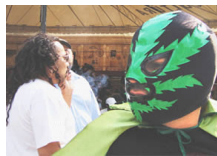
"Todos somos estigmatizados"