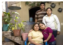
Welcome to Michoacán