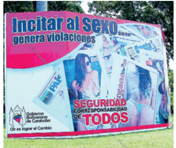
mensajes del paleolítico