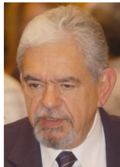
Gustavo Coronel, geólogo venezolano

Las políticas redistributivas de estos 10 años han consistido en transferencias directas y en programas sociales creativos pero