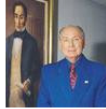
Pobre Andrés Bello!