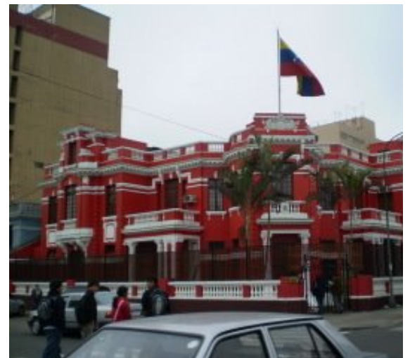
como será la embajada en Zimbabue?